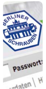
E-Business mit BERLINER SCHRAUBEN für schnellere Abläufe.